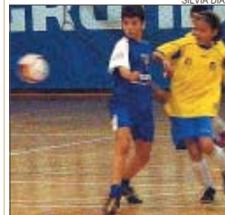
>> El planter segueix igual