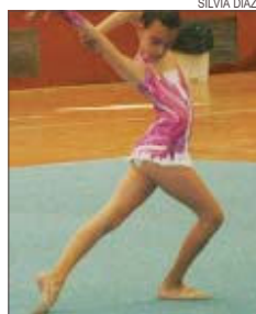
>> Exhibició de les gimnastes

Abans de fer vacances, el club gimnàstic participarà amb una exhibició a la festa de cloenda de les activitats anuals de La Unió, que tindrà lloc a la seu de l'entitat (av. Catalunya, 16-18), el 8 de juliol a la tarda. La propera temporada del club gimnàstic començarà al setembre però les persones que s'hi vulguin inscriure han de formalitzar la matrícula durant el mes de juliol. SD