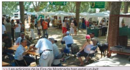
>> Les edicions de la Fira de Montcada han estat un èxit

Mas Duran acollirà l'1 i el 2 de juliol la primera edició de la Fira de Caça de Barcelona, organitzada per la Societat de Caçadors El Tordo i l'Associació Fira de Caça de Montcada. L'esdeveniment, fins ara d'àmbit local, ha donat un salt qualitatiu i quantitatiu important, ja que s'ha passat d'un matí a dos dies i és prevista la participació d'una trentena d'expositors d'arreu de Catalunya i de l'estat espanyol. La Fira començarà dissabte amb amb les exposicions de gossos de caça i d'armes, una exhibició de gossos mostra i tir amb arc i dues xerrades sobre la caça menor i major. A les 12h tindrà lloc una missa campestre a Sant Hubert oficiada pel bisbe