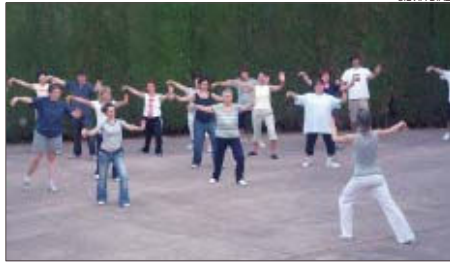
>> Els cursos d'estiu de tai-txí es va inaugurar el 26 de juny