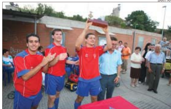
&gt;&gt; Els jugadors del Sant Joan van rebre el reconeixement del club i socis