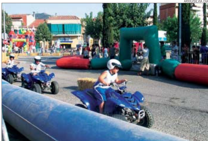
>> La festa de cloenda de l'any passat va reunir centenars de persones

Dades anuals. Segons Parra, cada any participen unes 2.000 persones en el conjunt d'activitats d'estiu que proposa l'IME, on s'inclouen els actes al carrer, els cursos a la Zona Esportiva Centre i els Casals d'Estiu. El pressupost de les activitats esportives que formen el programa Estiu 2006 de l'Ajuntament de Montcada i Reixac puja a 21.000 euros.