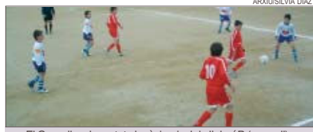
>> El Granollers ha estat el màxim rival de l'aleví B (vermell)