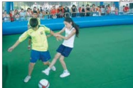
>> Partit de la Diada de futbol sala a Can Cuiàs