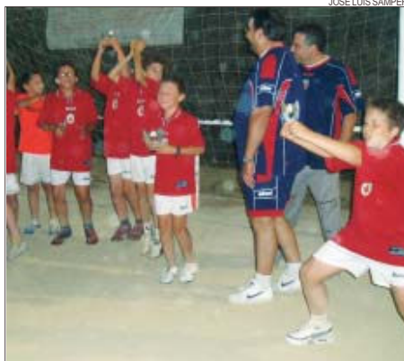
>> L'equip benjamí A mostra els seus guardons