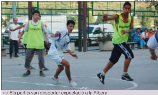
&gt;&gt; Els partits van despertar expectació a la Ribera

de la Ribera— a preparar un nou campionat a la tardor. "L'esport és una eina excel·lent per treballar el civis-