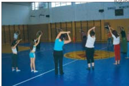
>> El curs de danses orientals és una novetat d'aquest any