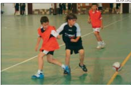
>> Els benjamins preparen l'any vinent

Els responsables de la base del CFS Montcada estan dissenyant l'estructura del planter i preparant els equips per a la propera temporada. El club farà proves als possibles futurs jugadors de l'entitat durant tot el mes de juliol a la pista municipal coberta. L'objectiu és formar un equip per a cada categoria, prebenjamí, benjamí, aleví, infantil, cadet i juvenil, a excepció de la benjamí, en la qual hi haurà dos conjunts. En total, el club vol aconseguir set equips de base, un menys que aquesta temporada, en què hi havia dos cadets. L'entitat encara té obert el termini d'inscripció per a infants i joves. Els interessats es poden adreçar a la seu del CFS Montcada, al carrer Tarragona, 5. D'altra banda, l'equip benjamí -que la temporada vinent esdevindrà aleví- jugarà un torneig els dies 1 i 2 de juliol a Torribera (Santa Coloma de Gramenet). SD