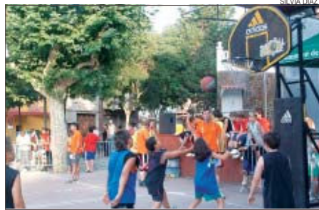
>> El torneig va comptar amb gairebé 80 participants

El bàsquet obre les activitats al carrer