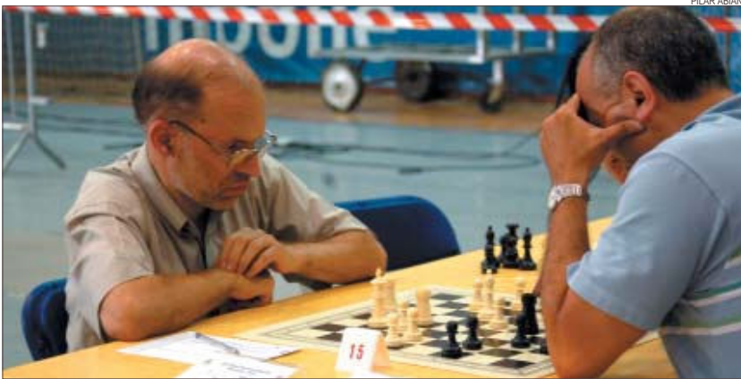
>> El gran mestre brasiler Henrique Mecking –a l'esquerra– és el número 1 del rànquing