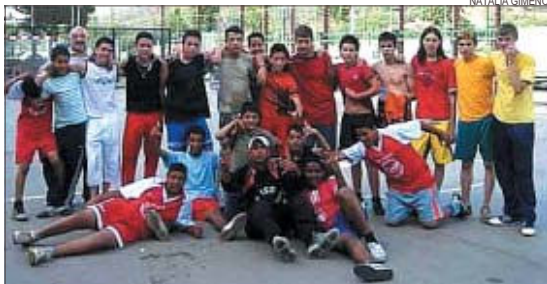
&gt;&gt; Alguns dels participants en la categoria infantil del torneig

L'èxit de la primera edició ja ha portat als organitzadors —responsables del Pla Integral